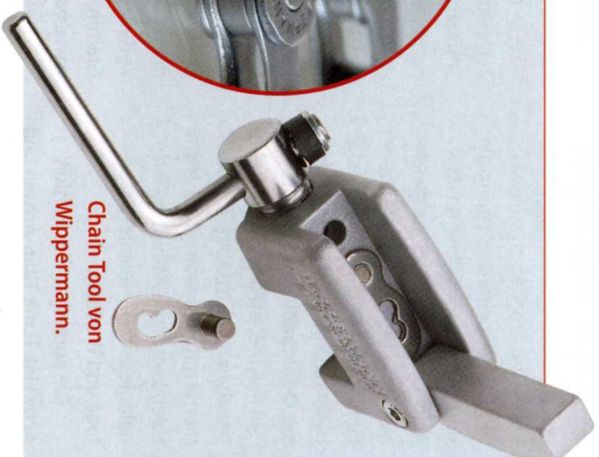
Chain Tool von Wippermann.